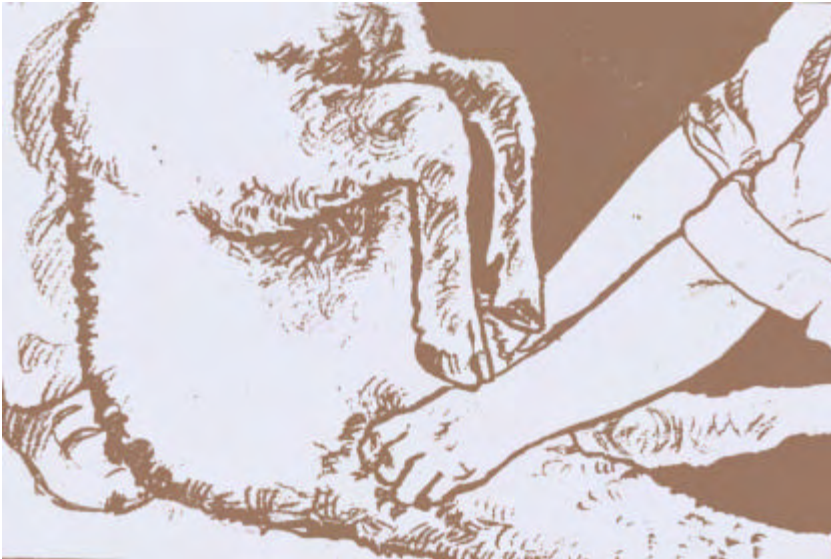
Fig. 5: Palpación de ganglios precrurales.