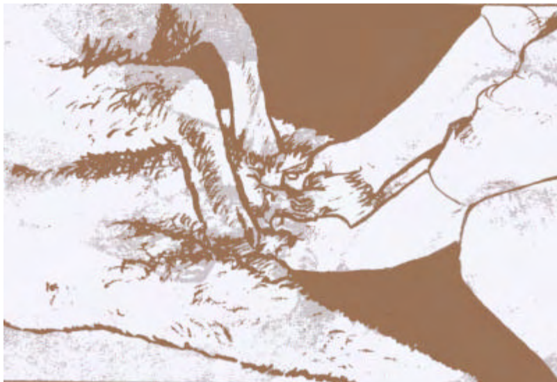
Fig. 7: Palpación de testículos y epidídimos.