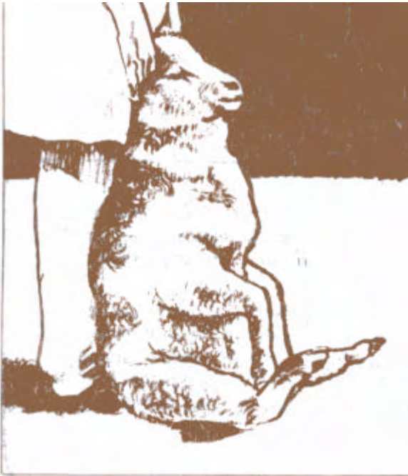
Fig. 1: Posición del carnero y del operador que sujeta al animal.

Se comienza con una vista general del animal, para detectar algún defecto corporal muy llamativo, ver estado de las pezuñas, y tomar al mismo tiempo el número de caravana o tatuaje.