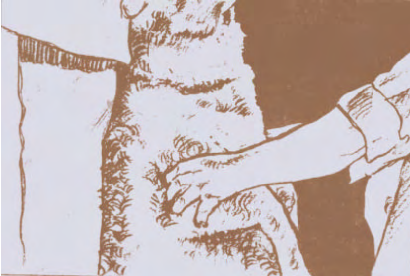
Fig. 4: Palpación de ganglios prescapulares.