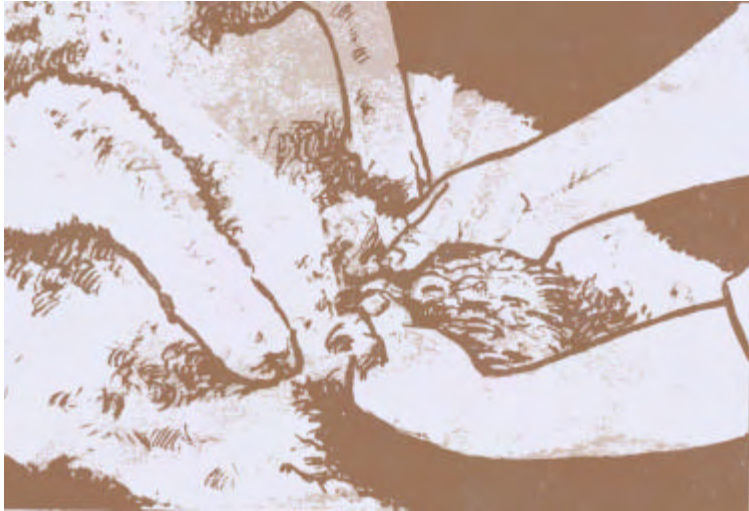
Fig. 8: Revisación del pene y prepucio.

Se palpan detenidamente y simultáneamente ambos testículos con ambas manos, a fin de ir comparándolos permanentemente en los diferentes aspectos de la evaluación. (Fig.7).