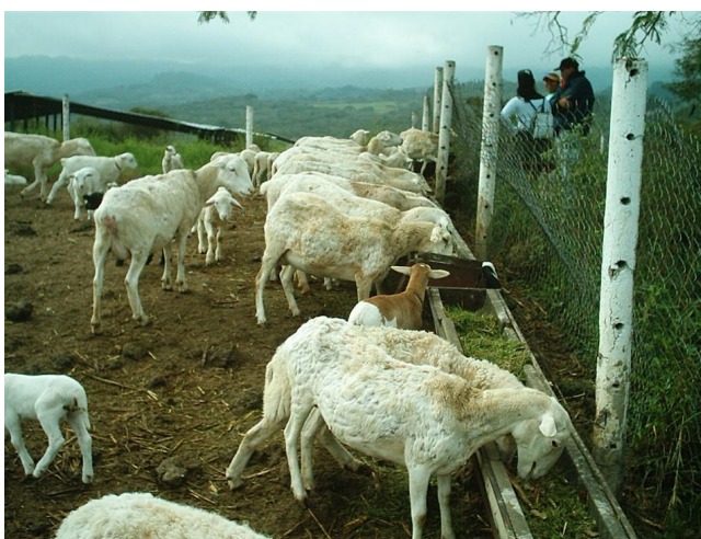
Foto 3. Rebaño de ovejas en lactancia que mantienen una condición corporal aceptable debido a que se cuidó el rebaño de cría en la gestación y la lactancia.

Foto 2. Rebaño de cría en lactancia, que no fue preparado adecuadamente en la gestación y que no está recibiendo la cantidad y calidad de alimento adecuado.