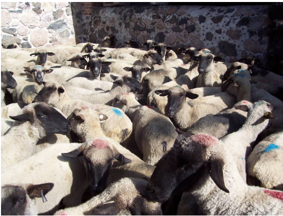
Fotos 6 a y b. Carneros con anilina y aceite en el pecho y ovejas marcadas por esos carneros.