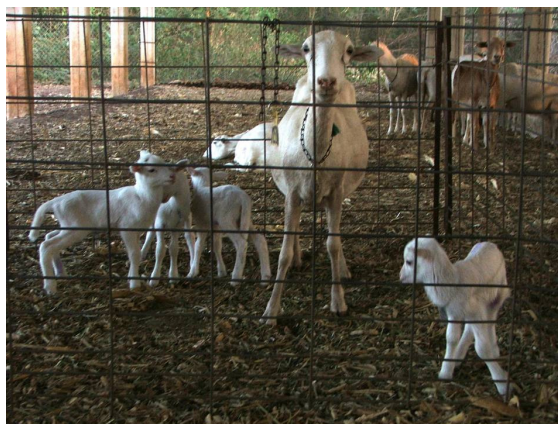
Foto 1. Oveja con cuatro corderos, producto de una buena elección de época de apareamiento y cuidados de la oveja pre-empadre.

Si el objetivo es obtener más de un parto al año, se recomienda además de usar el efecto macho, suplementar las ovejas si es necesario y colocar una buena cantidad de machos: