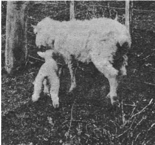
Fig. 2-La oveja está atada al alambrado para dar al cordero mayor facilidad. La oveja aceptará al cordero oportunamente.

Hay métodos de adopción más simples y también hay métodos más complicados. Y ahora vamos a detallar algunas técnicas practicadas en Nueva Zelanda: