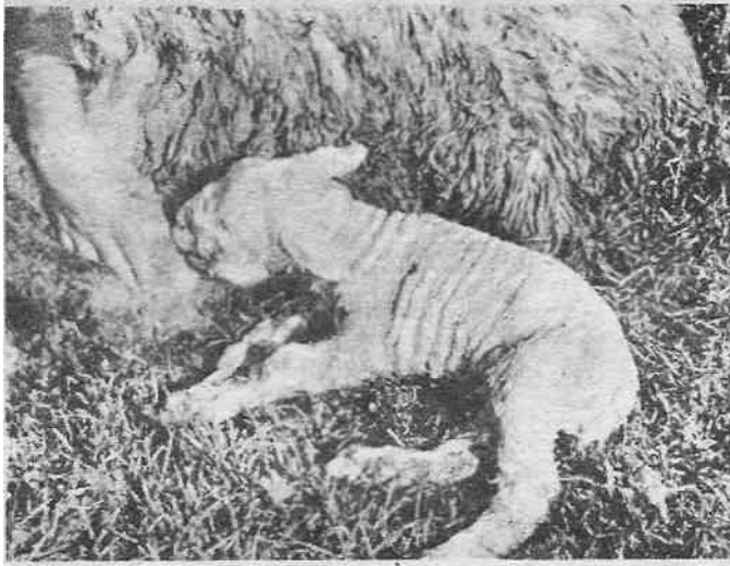
Fig. 3 - La oveja está retenida por medio de un cepo hecho con una bolsa abierta, que deja libre la ubre para el cordero adoptivo. Fig., 4 - El cordero es ayudado en su primera succión de la ubre de la oveja.