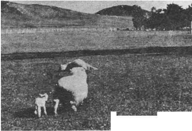
Fig. 5 - El huérfano está aceptado y son ahora inseparables.

La técnica de adopción de corderos es una práctica de gran valor. Todo lo que se requiere del cuidador es paciencia y un poco de saber como hacerla y una adaptación práctica a las circunstancias, la cual se inspira en el sentido común.